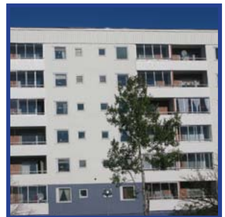
Branta Backen, Botkyrka