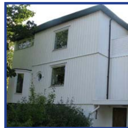
Termoskyddad träfasad, Lerum

Bilden visar ett typiskt exempel på relationen mellan kostnaden att måla, termoskydda resp. tilläggsisolera en byggnad.